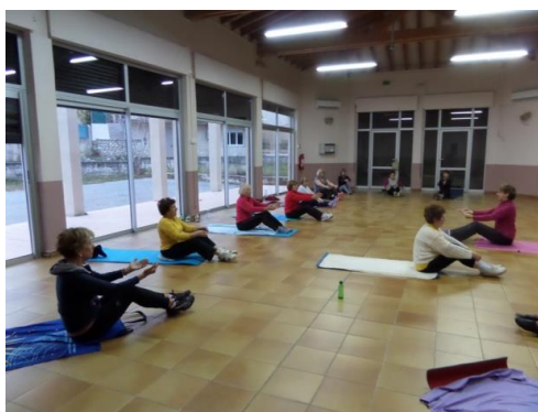
STRETCHING mardi 16h-17h et vendredi 15h-16h