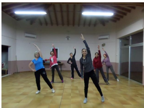
GYM DYNAMIQUE mardi 18h30-19h30