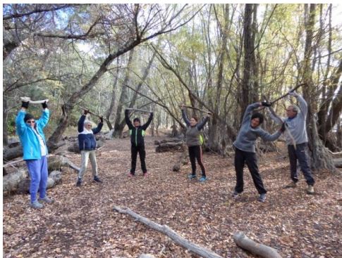
GYM PLEIN AIR mercredi 10h45-11h00

On respire ! Le sport permet de ralentir votre rythme cardiaque et d'améliorer votre respiration. Qui plus est, pratiqué en plein air, il est la bouffée d'oxygène et de nature dont on a bien souvent besoin dans un emploi du temps bien chargé.