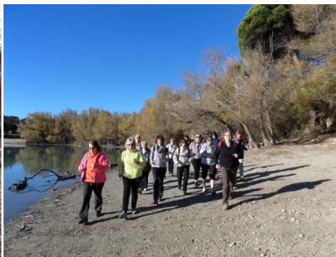
ACTI'MARCHE lundi 10h-11h